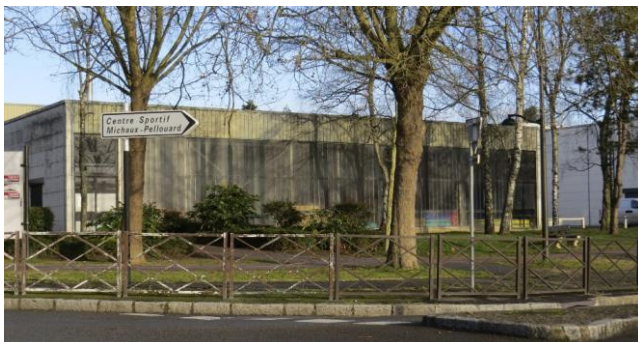
Le Chesnay : rénovation énergétique gymnase Pellouard