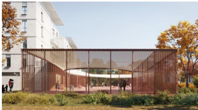
Vélizy : future école élémentaire Simone Veil