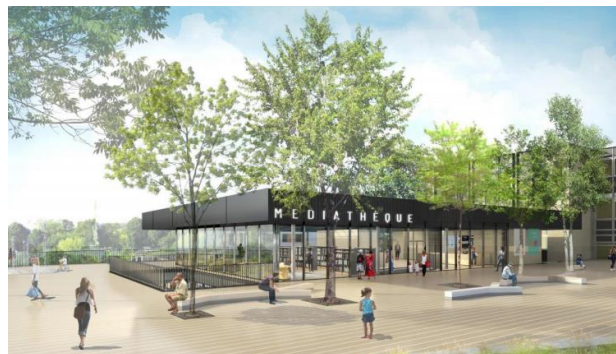
La Celle St Cloud : médiathèque