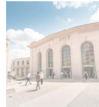
Versailles : parking souterrain de Versailles-Chantiers