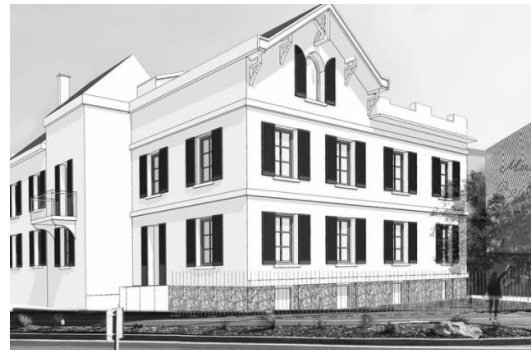
Bougival : rénovation maison de Berthe Morisot