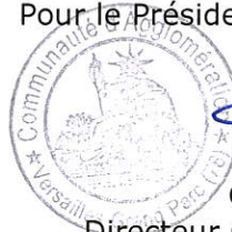
Olivier BERTHELOT Directeur Général des Services

2016 1 2 3 4 5 6 7 8 9 10 11 12 13 14 15 16 17 18 19 20 21 22 23 24 25 26 27 28 29 30 31 32 33 34 35 36 37 38 39 40 41 42 43 44 45 46 47 48 49 50 51 52 53 54 55 56 57 58 59 60 61 62 63 64 65 66 67 68 69 70 71 72 73 74 75 76 77 78 79 80 81 82 83 84 85 86 87 88 89 90 91 92 93 94 95 96 97 98 99 100